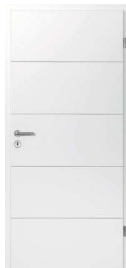
▲ Drzwi z serii DesignLine, Stripe 15 Duradecor, lakier biały