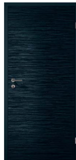
▲ Drzwi z serii ConceptLine Duradecor, powierzchnia strukturalna