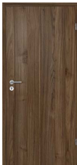
▲ Drzwi z serii BaseLine Duradecor, powierzchnia strukturyzowana, orzech

Przepiękne forniry z naturalnego drewna - dębu, klonu, orzecha, włoskiej akacji czy buku – w kilku odcieniach, wysokiej jakości lakierowane powierzchnie w rozmaitych kolorach, a także szeroka paleta designerskich aplikacji, ciekawych przeszkleń i subtelnych detali pozwolą nam wybrać drzwi z charakterem. Takie, które będą harmonijnym dopełnieniem naszych czterech kątów, tych tradycyjnych, a nawet rustykalnych, jak i nowoczesnych, minimalistycznych.